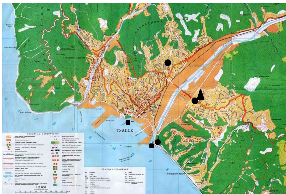
Рисунок 3 - Карта-схема г. Туапсе с расположением точек отбора проб воздуха и воды.

Для проведения наблюдений были выбраны следующие точки отбора проб (рисунок 3):