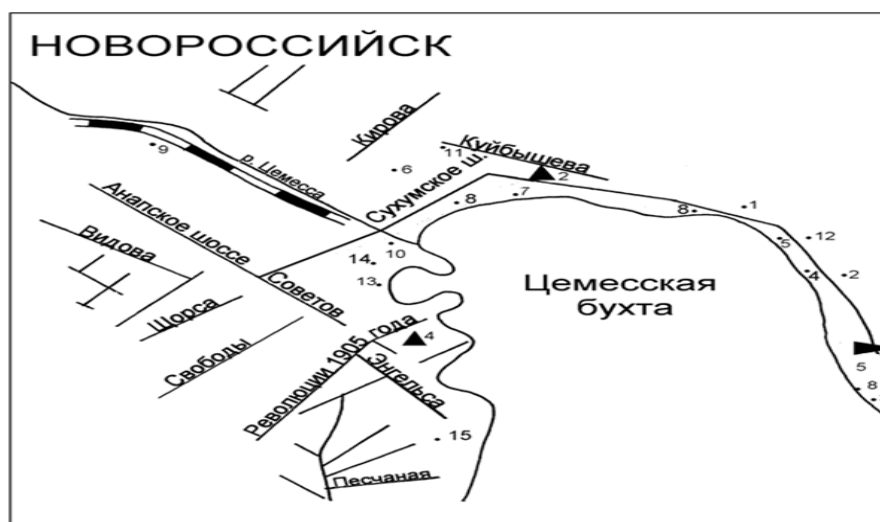
Рисунок 2 – Схема г. Новороссийска с расположением постов наблюдений.

Измерения проводятся в сроки 07:00; 13:00; 19:00 часов на ПНЗ № 2 и ПНЗ № 5. На ПНЗ № 4 наблюдения проводятся в сроки 08:00; 14:00; 20:00 часов по неполной программе. Схема города с расположением постов наблюдений см. ниже.